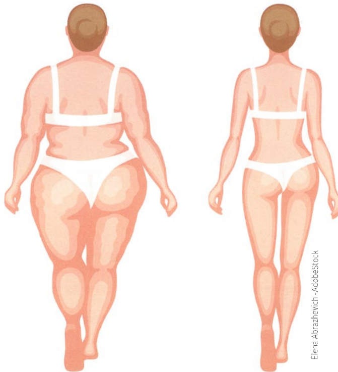
Elena Abrazhevich - AdobeStock

“Je troeven uitspelen, kan de aandacht afleiden van lichaamsdelen waar we meer complexen over hebben en die moeilijker perfect in vorm te krijgen zijn. Billen en borsten uitspelen om de aandacht van een buikje af te leiden... Waarom niet?”