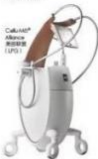
78 ELLE JULY 2019

在后躺时则明显变得轻松,最令我放心的是,整个疗程都是采用非侵入式的物理性刺激,30分钟完全放松的时间可以收获肉眼可见的效果,换好衣服走出操作间的我还在感叹这台仪器的神奇,就有点开始期待以疗程后我的身体会发生的变化了。