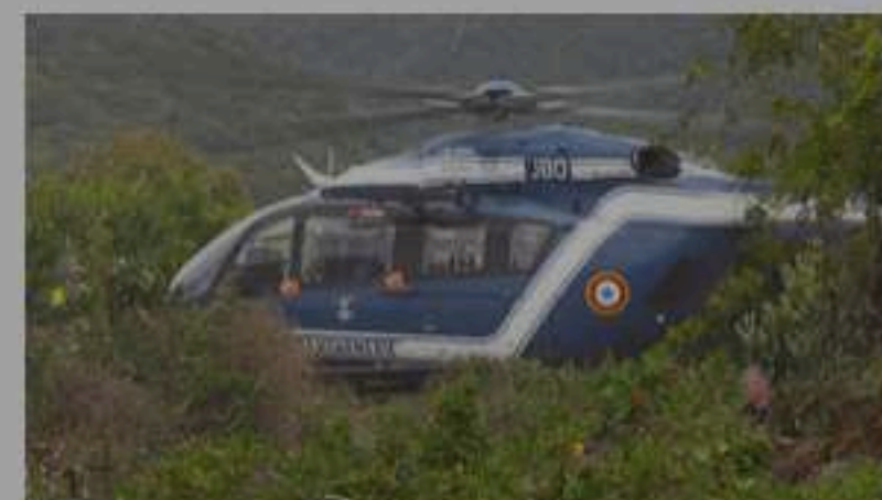
5 Le Dimitile : découverte du corps sans vie d'un septuagénaire dans un sentier