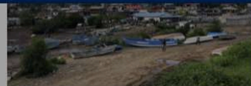
3 Fortes pluies : Mayotte placée en vigilance orange, selon Météo France