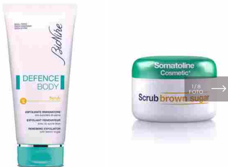
Bionike, Defence Body Scrub

Il primo step per dire addio alla cellulite è quello di preparare la pelle nel modo giusto e la risposta è solo una: lo scrub . Grazie all'azione esfoliante, che può essere di tipo chimico o fisico, questo prodotto da utilizzare due o tre volte a settimana, andrà a riattivare la circolazione e, allo stesso tempo, a eliminare il primo strato superficiale di cute. In questo modo, la texture del prodotto anticellulite andrà a penetrare ancor più in profondità.