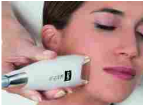
Sos Natale e Capodanno: trattamento last minute per il viso