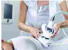
Endermologie LPG, sublimatore di snellezza