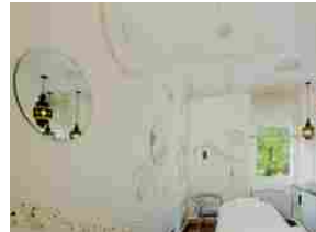
Remise en forme vista lago, pacchetto speciale al Grand Hotel Des Iles Borromées di Stresa