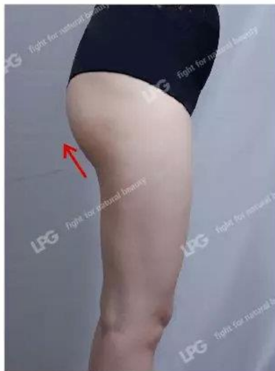
15次操作后 15 Sessions After