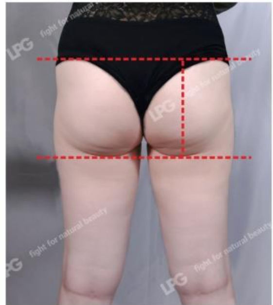
15次操作后 15 Sessions After