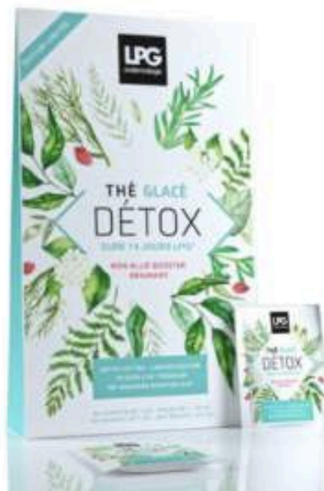
Thé glacé glacé détox LPG

il s'agit d'un thé avec des ingrédients naturels qui permet de libérer nos émonctoires des toxines accumulées et de purifier notre organisme pour retrouver un teint frais et un corps plein de vitalité !