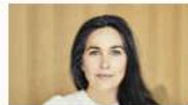
Florent Pagny : sa femme, Azucena...