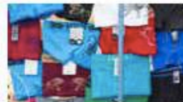
Shopping homme : les sous-vêtements