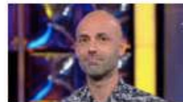
N'oubliez pas les paroles : ces deux...