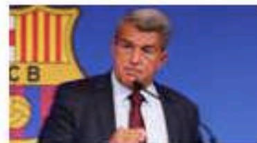
Xavi n'était pas la priorité de Laporta et...