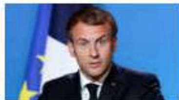
Sous-marins: E. Macron «sait» que S...