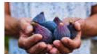
Lorsque l'on déguste une figue, on mange...