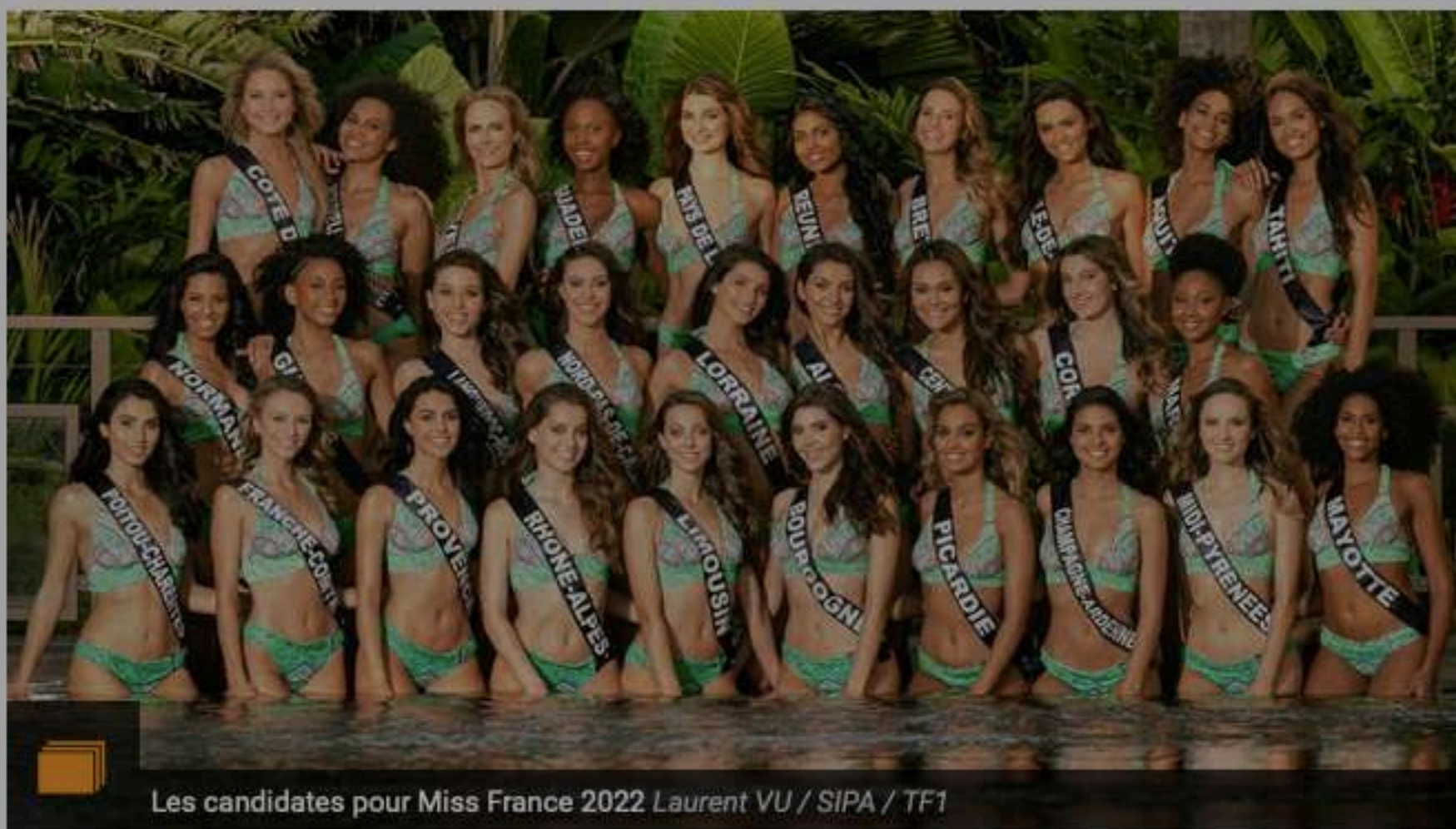
Les candidates pour Miss France 2022

Comme chaque année, les candidates au concours Miss France ne repartent pas les mains vides, loin de là. Depuis son rassemblement à Paris mi-novembre, l'ensemble de la promotion 2021 a eu le plaisir de découvrir les cadeaux remis par l'ensemble des partenaires. La cérémonie de l'élection de Miss France 2022 se tient samedi soir au Zénith de Caen à partir de 21h05 en direct sur TF1 avec Jean-Pierre Foucault et Sylvie Tellier à l'animation. Découvrez-ci-dessous la liste complète des cadeaux.