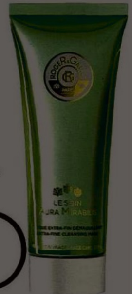
Prix donnés à titre indicatif.