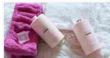
CHANEL CHANCE EAU VIVE PER UN BAGNO DA SOGNO

I recommend to move a little bit while doing the treatment.... It does not do miracles guys you need to be active which means that if you have time to just try walking a little bit around the city, choose to jog in the