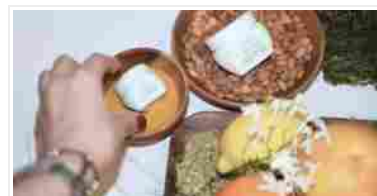
AVEDA E LA TULASARA WEDDING MASQUES OVERNIGHT