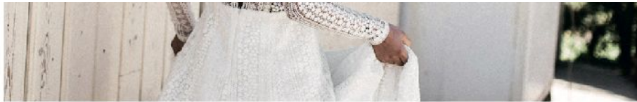
© Quique Magás para Wedding Style Magazine / Realización Saray Ceca