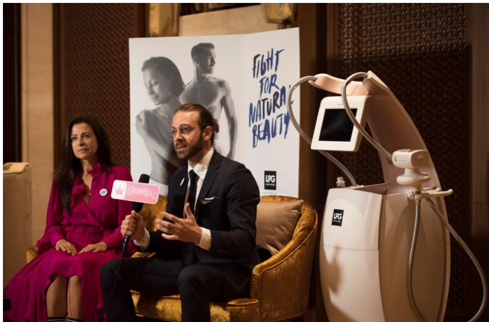
亚洲限量版现场拍卖 LPG捐助慈善公益事业

LPG®第十代ALLIANCE再次打破规则,挑战传统观念,在过于激进与过于温和的美容方式之间找到一把平衡之匙,将引领21世纪美容、健体、抗衰的一股时尚潮流,为更多有健康塑美需求的人士带去福祉。