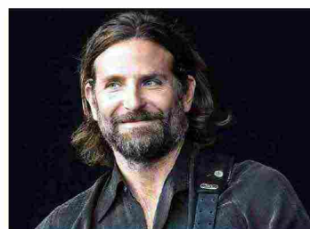
VISO E CORPO