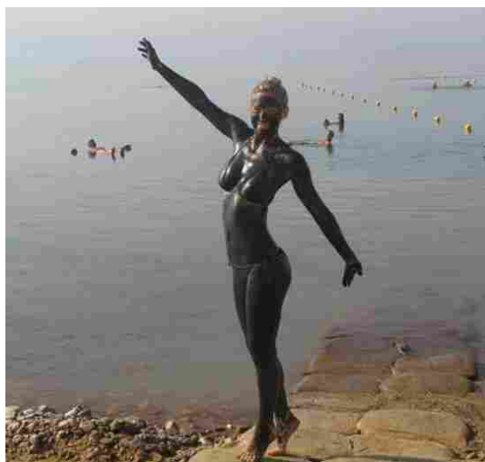
Bar Refalei sotto i fanghi del Mar Morto.

› Cellulite rimedi efficaci a casa: tempo di fanghi e automassaggi