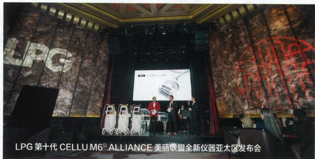
LPG 第十代 CELLU M6® ALLIANCE 美丽联盟全新仪器亚太区发布会

近日，于澳门银河，法国“时尚健康设计师”LPG 第十代 CELLU M6® ALLIANCE 美丽联盟亚太区首发仪式盛大启幕。来自全国各地的潮流人士齐聚澳门，率先体验 LPG 崭新进化的科技结晶，共同见证 LPG endermologie 的高科技美体能量，共同揭开了全新第十代仪器的神秘面纱。