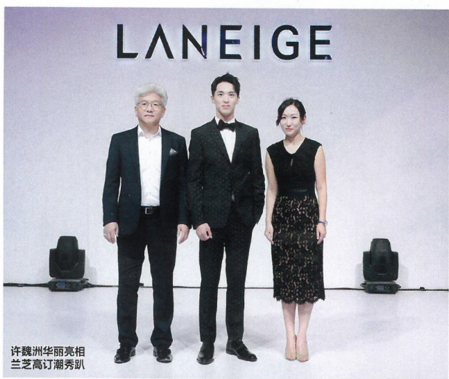
许魏洲华丽亮相兰芝高订潮秀趴