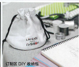
订制区 DIY 收纳包