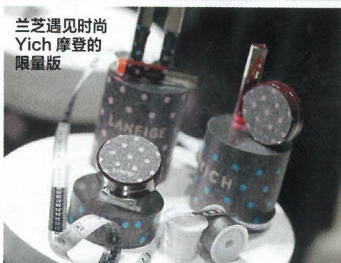
兰芝遇见时尚 Yich 摩登的限量版