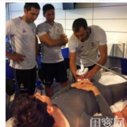
Real Madrid Physics at Work

而来自法国的LPG endermologie? (智慧健体系统)是用高科技打造人体年轻态的“智慧健体”专家,在全球更享有“来自法国的时尚健康设计师”的美誉,同时也是许多足球运动员放松身心、物理康复治疗时的常备利器,经过30多年科技不断创新,始终秉承“愉悦、自然、非侵入”的理念,利用结缔组织唤醒专利(专利号W02015185813A1等),唤醒沉睡细胞,重启肌肤自我更新机制,减少身体劳损,并实现形体线条管理。