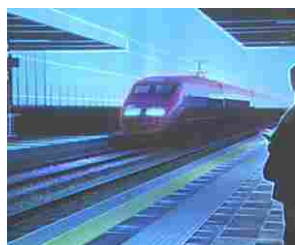
Così l'Alta Capacità cambierà il volto della città