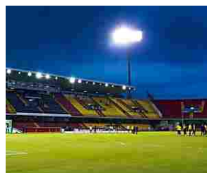
Stadio, ecco la posizione ufficiale del Comune