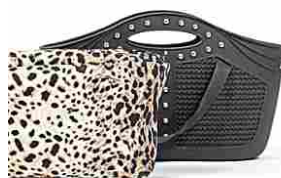
Borsa versatile, elegante e pratica, scegli il tuo colore! Bama