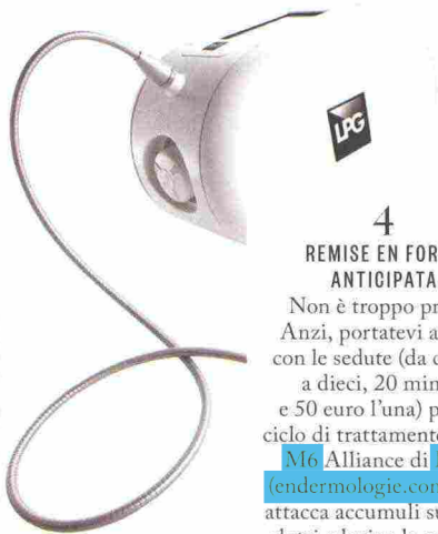
ILLUSTRAZIONE DI CINZIA ZENOCCHINI

Non è troppo presto. Anzi, portatevi avanti con le sedute (da cinque a dieci, 20 minuti e 50 euro l'una) per un ciclo di trattamento Cellu M6 Alliance di LPG ( endermologie.com ), che attacca accumulati su cosce, glutei e leviga la cellulite.