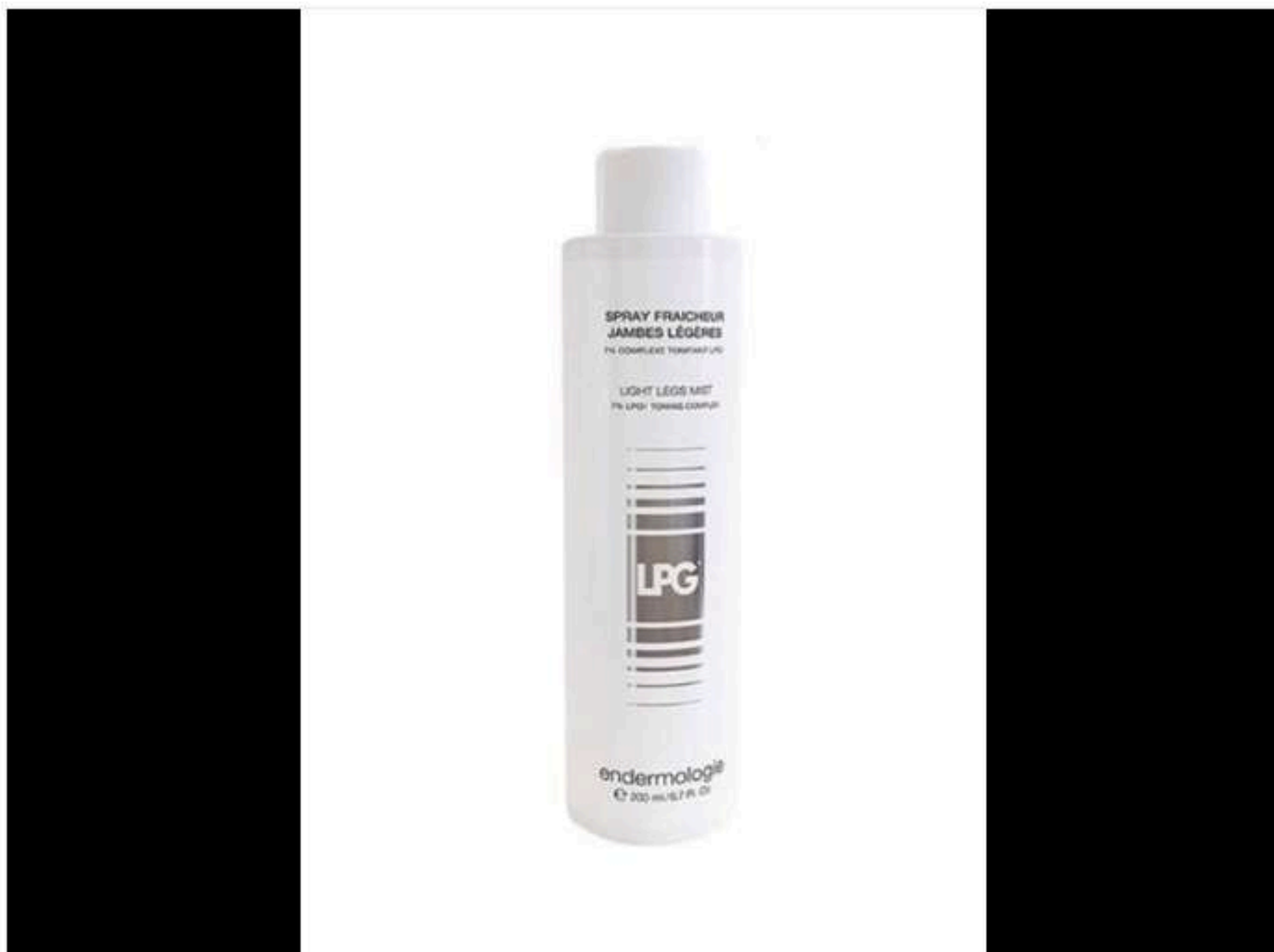
Spray Fraicheur Jambes Légères, LPG Endermologie, 30 €