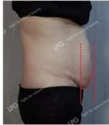
10次操作后 10 Sessions After