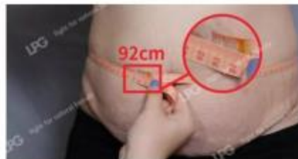
10次操作后 10 Sessions After